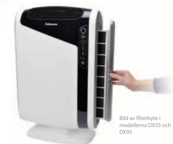
Bild av filterbyte i modellerna DX55 och DX95