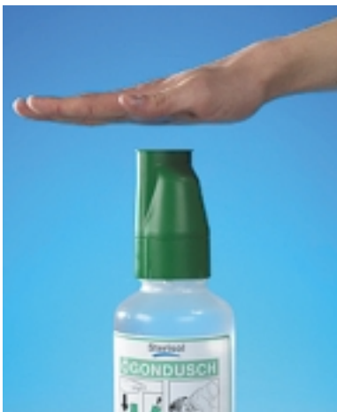
Slå hårt och bestämt med handen på den gröna skyddshuven!