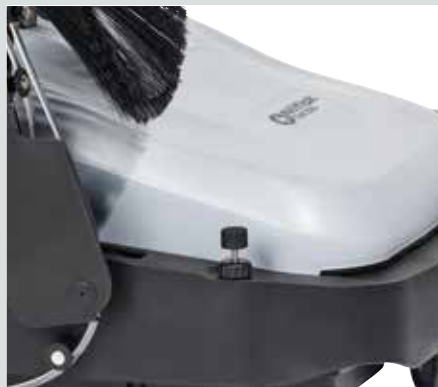
Både huvudborste och sidoborstar kan justeras helt utan verktyg