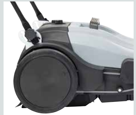
Handtaget kan justeras till passande arbetshöjd (3 lägen)