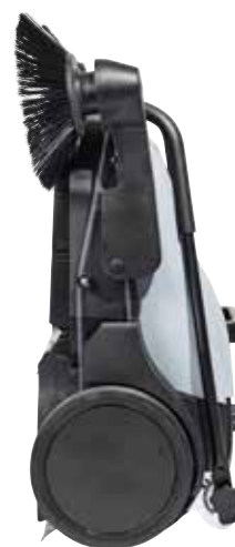
Behållaren hålls på plats även när sopmaskinen placeras för upprätt förvaring eller hängs upp på väggen, tack vare det fällbara handtaget.