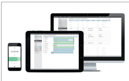
TimeMoto Cloud/TimeMoto Cloud Plus Art. nr: 139-0590/139-0591