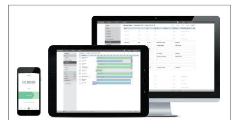
Alternativt TimeMoto Cloud (30 dagar ingår)