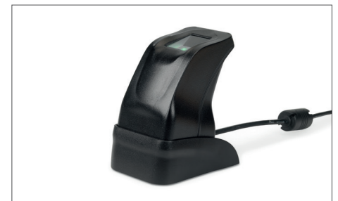
TimeMoto FP-150 USB Fingeravtrycksläsare Art. nr: 125-0606