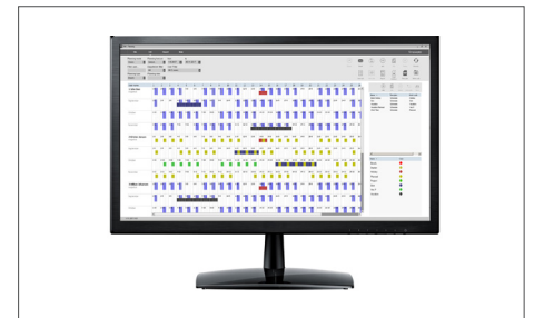
TimeMoto PC-program Plus Art. nr: 139-0600