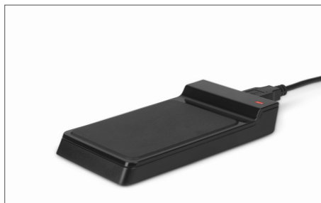
TimeMoto RF-150 USB RFID-läsare Art. nr: 125-0605