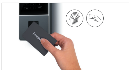
Stämpla in med RFID-bricka, fingeravtryck eller PIN-kod