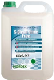
S-Clean Shine Free